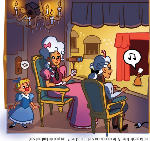
Solution : 1- l'ampoule sur la porte ; 2- le sucre d'orge dans la perruque du père ; 3- la cravate de la mère ; 4- la prise par terre ; 5- le nez de clown de la petite fille ; 6- le coucou qui sort du lustre ; 7- un pied de fauteuil scié.

7 Cherche les 7 anomalies qui se sont glissées dans la loge.