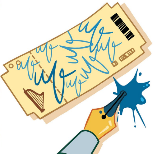
Solution : 8 fois.

4 Trouve combien de fois l'idole de Markus a signé son billet.