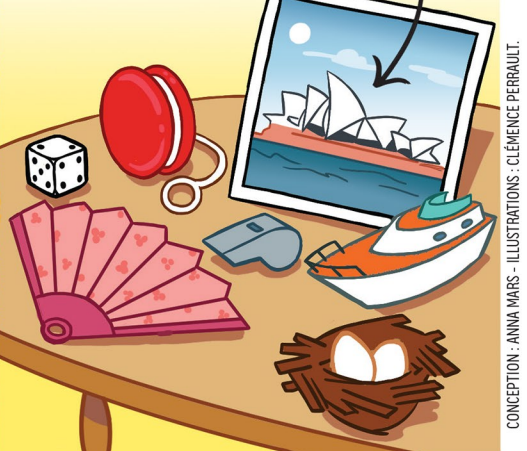
Solution : À SYDNEY, en Australie (S)rfite, Yo-yo, Dé, Nid, Éventail, Yacht).

8 Prends la 1 re lettre de chaque objet pour savoir où se trouve cet opéra futuriste, puis assemble-les toutes dans le bon ordre.