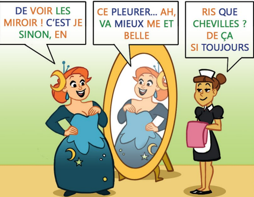
Solution : La Reine de la nuit : « Ah, je ris de me voir si belle en ce miroir ! » Son reflet : « C'est toujours mieux que de pleurer... » La servante : « Et sinon, ça va les chevilles ? »

1 Que disent les personnages? La Reine de la nuit prononce les mots orange, son reflet les mots bleus et la servante les mots verts.