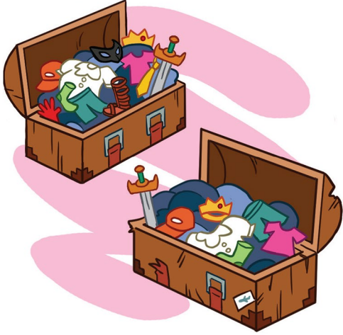
Solution : La cravate jaune, le masque noir, le gant rouge et une sandale romaine.

2 Repère les affaires qui manquent dans la malle de la costumière après son voyage en avion.